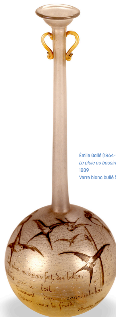
Émile Gallé (1864-1904), La pluie au bassin fait des bulles 1889 Verre blanc bullé à décor émaillé