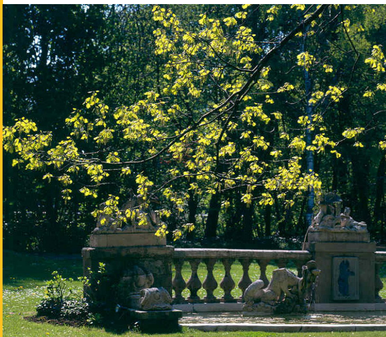
Vue du parc Corbin (détail)