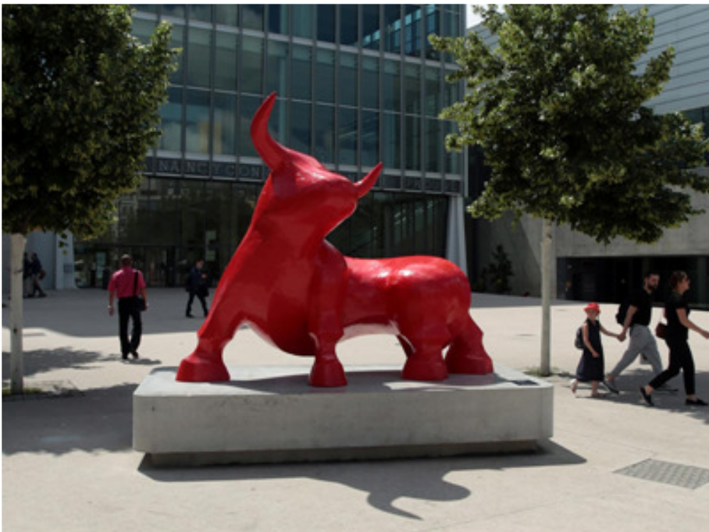
Le Taureau , Gé Pellini, Place de la République, Nancy, 2018.