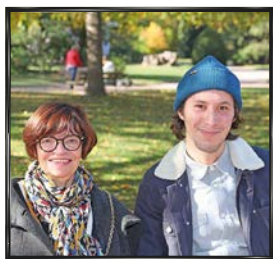
# MON DÉSERT