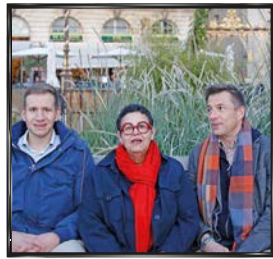
# LÉOPOLD VILLE VIEILLE