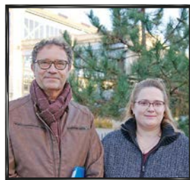
# RIVES DE MEURTHE