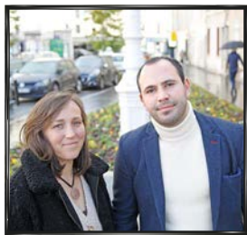
# 3 MAISONS