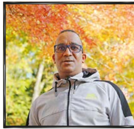
# PLATEAU DE HAYE