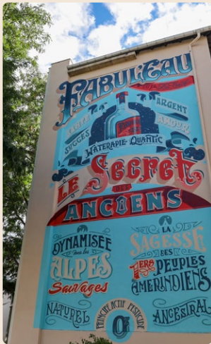
@Adagp, Paris, 2023