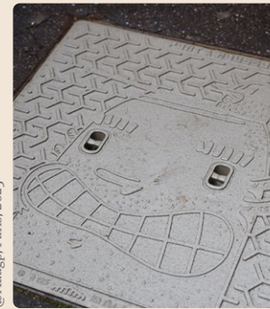
@Adagp, Paris, 2023