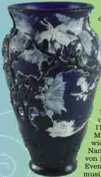
Émile Gallé, Vase „Nuit Japonaise“

Veranstaltungen, Sommerkonzerte, Licht- und Toninszenierungen auf der Place Stanislas, Nikolausfest u. a.