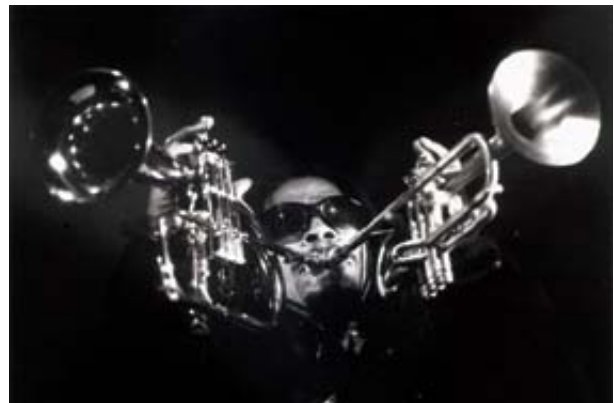
© Philippe Leher | NJP 2005

> Vernissage vendredi 06 octobre à 18h30