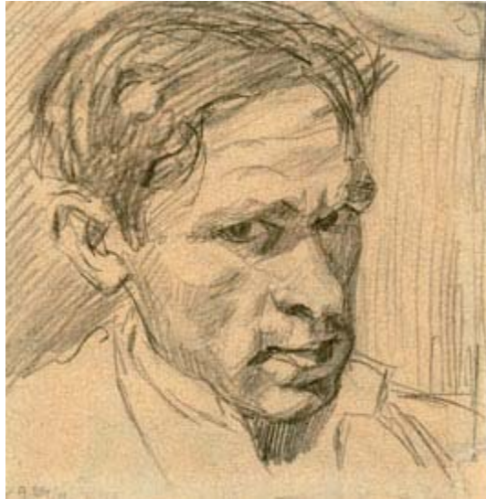
autoportrait , 1935 - Bruno Schulz musée de la Littérature, Varsovie

Né en 1892 dans la petite ville de Drohobycz en Galicie austro-hongroise, rattachée à la Pologne en 1918 et à l'URSS en 1945, Bruno Schulz est le fils d'un marchand drapier. Passionné d'architecture, il part faire des études à Lwow et, à la mort de son père, revient dans sa ville natale où il sera professeur de dessin jusqu'à sa mort.