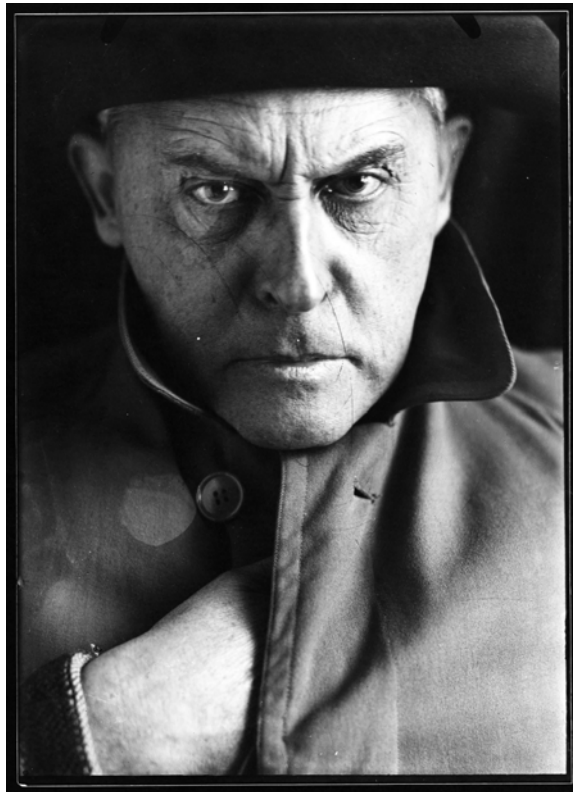
Stanislaw I. Witkacy comme Napoléon, 1937-39

Né en 1885 à Varsovie, le peintre, dramaturge, romancier et essayiste Stanislaw Ignacy Witkiewicz s'est très tôt attribué le surnom de « Witkacy » afin de se distinguer de son père, le peintre Stanislaw Witkiewicz, qui fut à Zakopane, l'un des principaux animateurs du mouvement de renouveau culturel polonais de la fin du XIXe siècle. Celui-ci l'initie très tôt à toutes les formes d'art notamment à la photographie : Witkacy a laissé dans ce domaine une œuvre riche avec d'extraordinaires portraits et autoportraits.