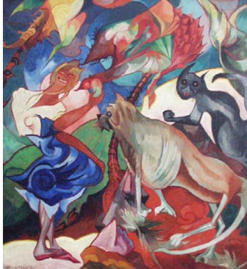
Marysia et Burek à Ceylan, 1920-21 - Stanislas I. Witkacy huile sur toile - musée national de Cracovie

aux couleurs chatoyantes, font apparaître d'inquiétantes sont tournées en dérision par les critiques pour leur caractère « bizarre ».