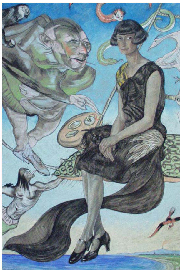
Portrait de Maria Nawrocka – Witkacy – musée national de Cracovie